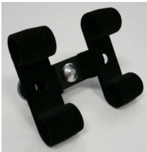
Doppel-Uhrhaltefeder Kunststoff schwarz beflockt / Double plastic spring black flocked

127 001 504 (WTA/Classic) 127 001 505 (WTS 220 black)