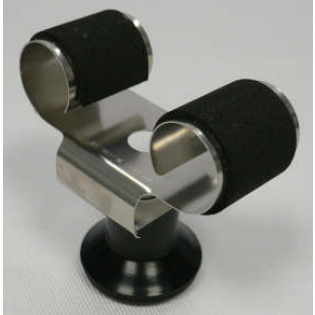
Kleine Uhrhaltefeder Metall WTS 4 / Small metal spring WTS 4

127 001 546 (WTA) 127 001 547 (WTS 220 black)