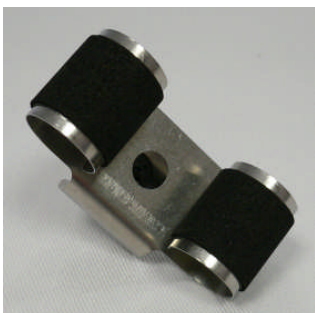
Kleine Uhrhaltefeder einfach Metall / Small single metal spring

127 001 523 (WTA) 127 001 522 (WTS 220) (all colors)