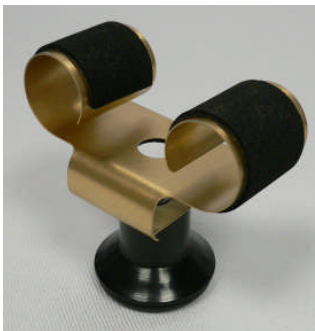
Kleine Uhrhaltefeder Metall gold WTS 4 / Small metal spring gold colored WTS 4