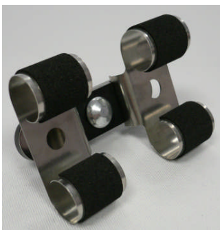
Kleine Doppel-Uhrhaltefeder Metall schwarzer Steg / Small double metal spring with black base

127 001 511 (WTA/Classic) 127 001 539 (WTS 220 black)