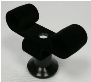
Uhrhaltefeder Kunststoff schwarz beflockt WTS 4 / Plastic spring black flocked WTS 4