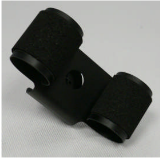
Kleine Uhrhaltefeder einfach Metall schwarz beschichtet / Small single metal spring black coated

127 001 546 (WTA) 127 001 547 (WTS 220 black)