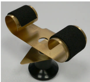
Uhrhaltefeder Metall goldfarben WTS 4 / Metal spring gold colored WTS 4