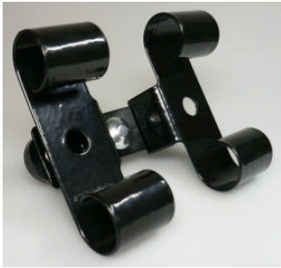
NEU! / NEW! Doppel-Uhrhaltefeder Metall schwarz komplett gummi beschichtet / Double metal spring black completely rubber coated

127 001 549 (WTA/Classic) 127 001 550 (WTS 220 black)