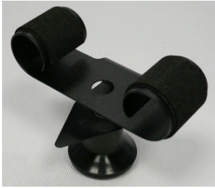
Uhrhaltefeder Metall schwarz beschichtet WTS 4 / Metal spring black coated WTS 4