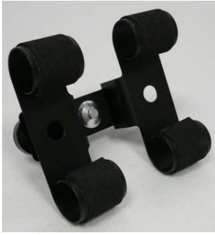
Doppel-Uhrhaltefeder Metall schwarz beschichtet / Double metal spring black coated

127 001 549 (WTA/Classic) 127 001 550 (WTS 220 black)