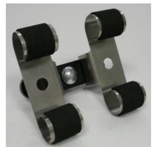
Doppel-Uhrhaltefeder Metall / Double metal spring