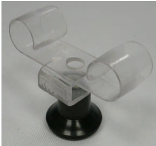
Uhrhaltefeder Kunststoff transparent WTS 4 / Plastic spring transparent WTS 4