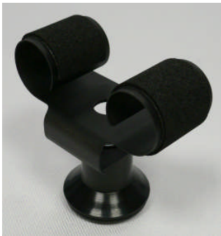
Kleine Uhrhaltefeder Metall schwarz beschichtet WTS 4 / Small metal spring black coated WTS 4