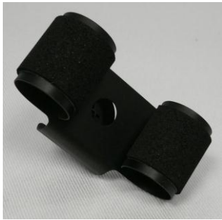
Kleine Uhrhaltefeder einfach Metall schwarz beschichtet / Small single metal spring black coated

127 001 546 (WTA) 127 001 547 (WTS 220 black)