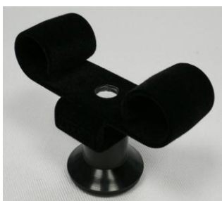
Uhrhaltefeder Kunststoff schwarz beflockt WTS 4 / Plastic spring black flocked WTS 4