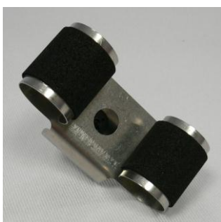
Kleine Uhrhaltefeder einfach Metall / Small single metal spring

127 001 523 (WTA) 127 001 522 (WTS 220) (all colors)