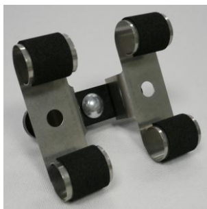
Doppel-Uhrhaltefeder Metall / Double metal spring