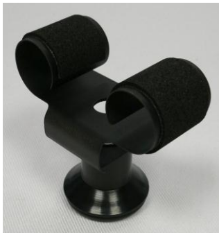
Kleine Uhrhaltefeder Metall schwarz beschichtet WTS 4 / Small metal spring black coated WTS 4