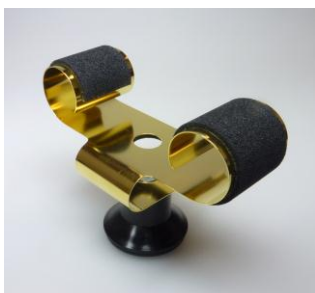
Uhrhaltefeder 24 Karat vergoldet WTS 4 / Metal spring 24 Carat Gold Plated WTS 4