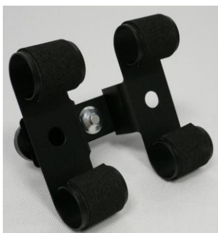
Doppel-Uhrhaltefeder Metall schwarz beschichtet / Double metal spring black coated

127 001 549 (WTA/Classic) 127 001 550 (WTS 220 black)