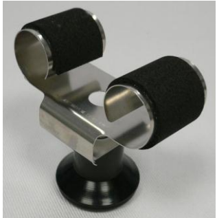
Kleine Uhrhaltefeder Metall WTS 4 / Small metal spring WTS 4

127 001 546 (WTA) 127 001 547 (WTS 220 black)