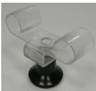
Uhrhaltefeder Kunststoff transparent WTS 4 / Plastic spring transparent WTS 4