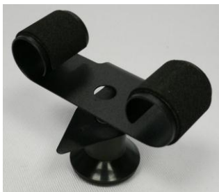
Uhrhaltefeder Metall schwarz beschichtet WTS 4 / Metal spring black coated WTS 4